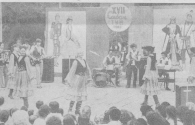
Пойтахтимизнинг Собир Раҳимов районига қарашли А. С. Пушкин номи маданият ва истироҳат боғида анъанави «Сабан тўй» байрами ўтказилди.

Н. ТАТАРИНОВ, ҳаваскор югурувчилар клубининг раиси.