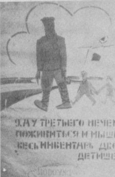
СУРАТДА: Тошкентдаги Ўзбекистон ССР Давлат санъат музейида намойиш этилаётган В. Маяковский чизган ўн икки плакатдан бири.

бир-бирига ҳамоҳанг ижодий қиёфаси, маънавий яқинлиги ўзига хос тасвирланган. Қутлуг Башаров ва Эркин Охунвалар «Ҳамза» номли альбом учун ишлаган ас-тампларда ҳам Маяковский ва Ҳамза ижодий гоёвий жиҳатдан бир-бирига ҳамоҳанглиги санъат воситасида ажойиб бир тарзда акс эттирилган. Яқинда Фафур Фулом номидаги адабиёт ва санъат нашриёти шоирнинг «Оқ ва қора» шеърини тўпламини нашр этди. Китоб Константин Воробьев томонидан ишланган суратлар билан безатилган. Иқтилоб жарчиси Маяковский ижоди республиканиз рассомлари учун туганмас илҳом манбаидир.