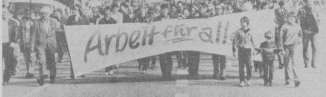
ГФР. Мамлакат экономикасидаги аҳвол ва ишчиларнинг муттасил ошиб бориши ГФРнинг Германия насаба соҳаларида индидий ташвиш уётмоқда. Улар монополиялар ва ҳукуматдан мавжуд иш жоғларини сақлаб қилиш ва янги иш жоғларини барпо этиш бўйича самарали тадбирлар кўришни талаб этмоқдалар.

«ТАШКЕНТ ОҚШОМИ»ГА ЖАВОБ БЕРАДИЛАР. «СИФАТЛИ БҮЛСИН». Газетанинг шу йил 9 июнь сонида юқоридаги сарлавха остида босилган мақолада «Ташкентборги» қарашли 39 ва 75-магазинларда сифатсиз нон маҳсулотлари сотилаётгани таъкид қилинган эди. Мақолага жавоб олинди.