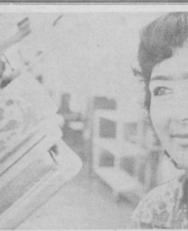
Ленин ордени Ўзбекистон Компартияси ва Ўзбекистон ССР 50 йилги номдаги тинувчилик ишлаб чиқариш бирлашмаси коллективининг халқ истеъмоли товарларини кўлаб ишлаб чиқармоқда. Шу кунларда қорхона коллективини ўрта синда йиллик планини моноажон Ташкентнинг 2000 йилгини шарофига мунасар илгари бажариш юзасидан бошланган мусобақа тобора авм олмақда.

Биз студент-қурилиш отрядларининг жангчиларига совет ёшлари ватанпарварлик ҳаракатининг аjoyиб анъаналарини, жасоратли меҳнат анъаналарини, ғамхўрлик ва биродарлик руҳини ривожлантириш ва уни қўйиштириш каби олий бурч ишониб топширилган. Биз қаерда ишламайлик, катта ўртоқларимиз — коммунистларга тенглашамиз, улардан совет халқи олдига турган тарихий вазифаларини ҳал этишда ягона мақсадни қўлаш ва ишбилармонлик фаизлатини ўрганишамиз. Биз ўзинининг асосий вазифамизни КПСС Марказий Комитетининг июнь (1983 йил) Пленумида партиямизнинг комсомолга берган нақизи — «Бошланган ишчи охиригача етказиш, алоҳида муҳим шароитлардагина эмас, балки олий, кундалик вазиғта ҳам юқоқ самарадорлик ва фидокорлик билан ишлаш маҳорати етишмалиги» — деган нақизини бажаришда деб биламиз. Азиз ўқимиз ва зарбдор меҳнатнинг партия ва ҳукуматимизнинг ёшлар тўғрисидаги ғамхўрликни энг муносиб жавоб бўла олади. Биз шаҳарини барча студент-қурилиш отрядлари жангчиларини Бутуниттифоқ студент-қурилиш отрядларининг 25-йилги меҳнат семестрида бажариладиган ишларининг самарадорлиғи ва сифатини оғинмай оширишга, меҳнат интизомини мустаҳкамлашга, ахл ўртасида иккинчи-сиёсий, спорт-оммавий ва маданият-оқарту ишларида актив қатнашишга, янги қизилчиларни бўлинишга, жонжон Коммунистик партиямизнинг қарорларини изобатлаш ва ягона мақсад билан ҳаётга тадбиқ этишга, удуғ Ленин вазиғи қилганидек яшаш, ишлаш ва ўқишга чақирамиз.