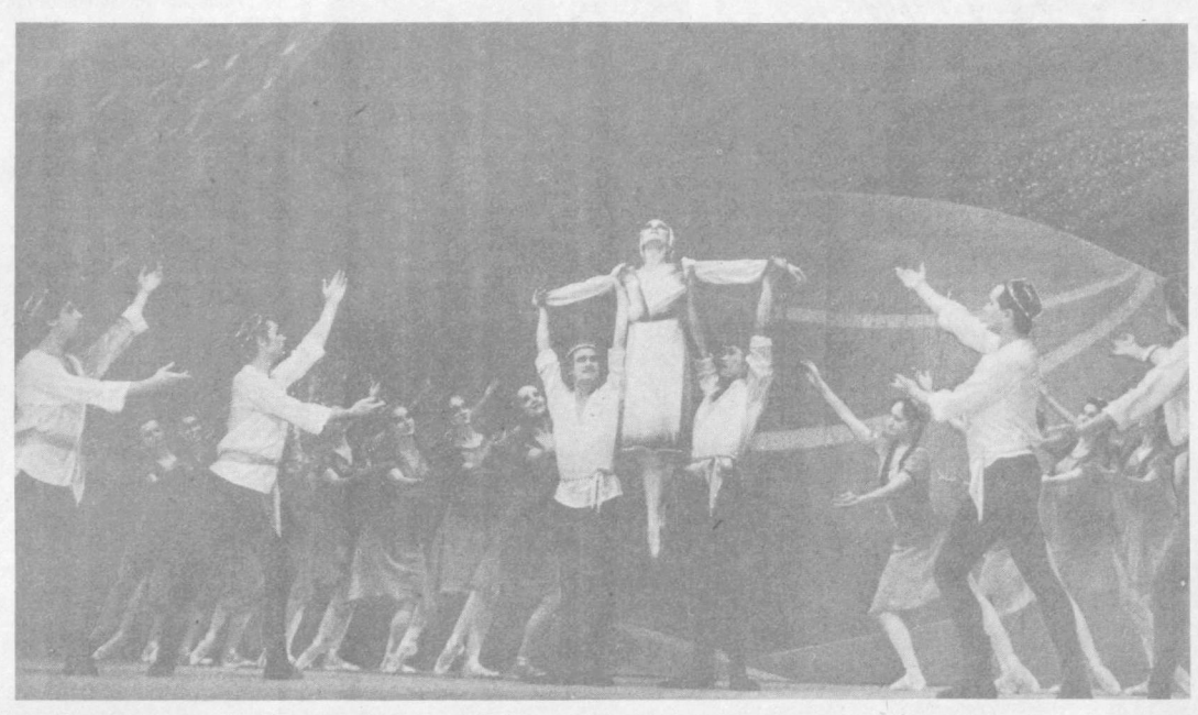
На сцене Узбекского государственного академического театра оперы и балета имени Алишера Навои идет балет-оратория «Поклонись солнцу» композитора Рустама Абдуллаева. Проведение отображает подвиг советских народов в Отечественной войне.

РОССИЯ Берез придорожные рожи, Омлет солнцем живые... Что может быть лучше и проше Знакомых пейзажей ее! Но вслушайся вместе со мною: Быть может, уловить и ты в беседе березок спокойной серебряный шелест джидды... Перевод с узбекского.