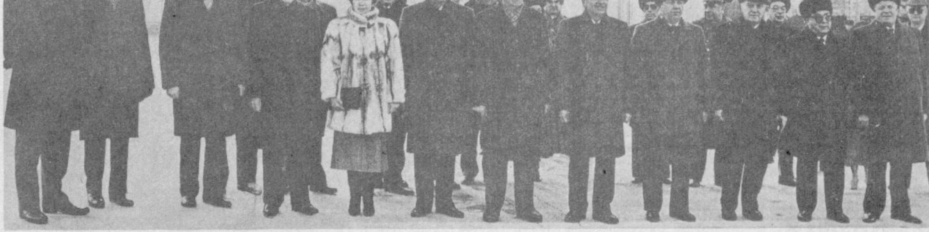
Во время проводов на аэродроме.

Н. Н. Слонов, М. С. Соломенцев, В. М. Чебриков, кандидаты в члены Политбюро ЦК КПСС П. Н. Демичев, В. И. Долгих, Н. В. Тальзин, Д. Т. Язов, секретари ЦК КПСС А. П. Бирюкова, А. И. Лукьянов, В. А. Медведев, Л. П. Разумовский, председатель Центральной ревизионной комиссии КПСС И. В. Капитонов, другие товарищи.