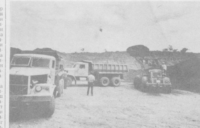
Совет «КрАЗ»лари Никарагуанинг қийин иқлим шартларида муваффақиятли ишлатилмоқда. Бу кўдратли ва мустаҳкам машиналарини мамлакат йўлларида, қурилиш ва корхоналарида тез-тез ўратиб кўриш мумкин.

«Эрдэнэт» кон бойитиш комбинатининг, «Монголсоветмет» бирикмасининг, марказий энергетика системаси ва бошқа корхоналарнинг коллективлари социалистик мусобақадда пешқадамлик қилмоқдалар. Ҳозирги вақтда монғол чорвадорлари 8 миллион бошдан кўпроқ эш мол етиштирмоқдалар. Доғли жанглари, қартошка, сабазвор экилган майдонлар бултурғидан 76 миң гектар кенгайтирилди.