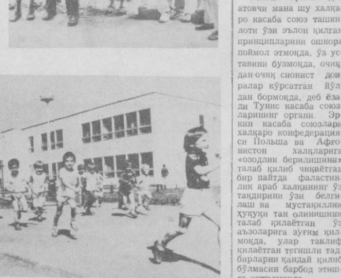
Чехослованияда ҳар йили шанба ва яқинба кўнлари шаҳар ва қишлоқларни ободонлаштириш ва қўқаламзорлаштириш бўйича ҳашар ўтказилиб туради. Ҳашар йўли билан стадион ва спорт майдончалари, болалар богчаси ва яслилари, социал-маънавий объектлар барпо этилмоқда. СУРАТДА: Прага-нинг Чаконце районидаги 120 болага мўлжалланган янги болалар богчаси. Унн шу район аҳолиси ҳашар йўли билан қурган.

ТУНИС. Эркин касабасоюзлари халқаро конфедерациясини халқларнинг озодлик ва ўз тақдирини ўзи белгилаш ҳўқуқларини амалга оширишга қарши чиққатган кўчлар қўлидаги нтоатгўй курул бўлиб қолди. Эркин касабасоюзлари халқаро конфедерациясининг яқинда Ослода бўлиб ўтган XIII конгрессини шунда қатнашган Тунис касабасоюзлари делегациясини мана шундай фикр ҳосил бўлди, деб хабар қилди «Аш-шаоб» газетаси. Ўзини «Эркин» деб атавици мана шу халқаро касабасоюз ташкилотини ўзи эълон қилган принципларини ошқоро поймол этмоқда, ўз уставиин бузмўқда, очиқдан-очиқ сионист доғралар қўрсатган йўлдан бормўқда, деб эъзади Тунис касабасоюзларининг органи. Эркин касабасоюзлари халқаро конфедерациясини Польша ва Афғонистон халқларига «озодлик берилишини» талаб қилиб чиққатган бир пайтда фаластинлик араб халқининг ўз тақдирини ўзи белгилаш ва мустақиллик ҳўқуқини таи олинишини талаб қилаётган ўз аъзоларига зуғим қилмоқда, улар тақлиф қилаётган тегизиш тадбирларини қандай қилиб бўлмасин барбод этишга интилмоқда.