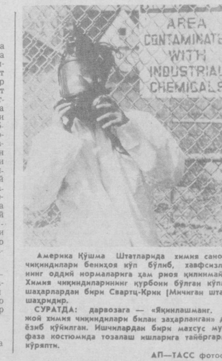
Америка Қўшма Штатларида химия саноати чиқиндилари бенхоқ куп бўлиб, хавфсизликнинг оддий нормаларига ҳам риоя қилинмайди. Химия чиқиндиларининг қурбон бўлган қўлпа шаҳарлардан бири Свартц-Крик (Мичиган штати) шаҳридир. СУРАТДА: дарвозага — «Яқинлашманг. Бу жой химия чиқиндилари билан захарланган деб ёзиб қўйилган. Ишчилардан бири махсус муҳофаза костюмида тозалаш ишларига таъйирилик кўрапти.