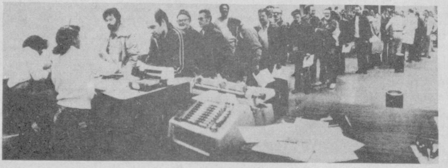
Меҳнат биржасида ишчиларнинг узун навбатда туриши (суратда) бугунги кунда Америка Қўшма Штатлари кўпгина шаҳарларига хос типик манзара бўлиб қолган. Улар орасида кўп йиллик меҳнат стажига эга бўлган тажрибали ходимлар ҳам оз эмас.

Шу кунларда Япония пойтахтида бўлаётган бошқа саудо иқтисодий музокараларда ҳам маълум шундай кескин иштироқлар ва бир-бирини айбашлар дивом этмоқда. Чунонки, Британия сановат конфедерациясининг президенти К. Фрейзер Япония иқтисодий ташкилотлар федерациясининг раҳбарлари билан учра-