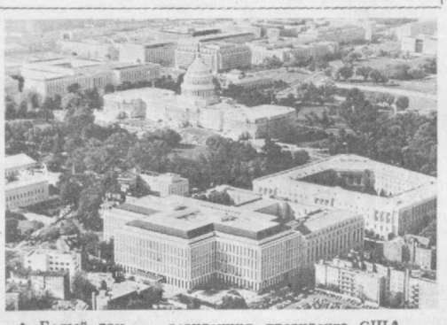
Белый дом — резиденция президента США. Общий вид столицы. В центре — Капитолий — здание конгресса США. На Вашингтонской улице.