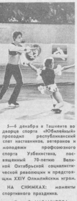
5-6 декабря в Ташкенте во дворе спорта «Юбилейный» проходил республиканский слет наставников, ветеранов и молодежи профсоюзного спорта Узбекистана, посвященный 70-летию Великой Октябрьской социалистической революции и предстоящим XXIV Олимпийским играм.