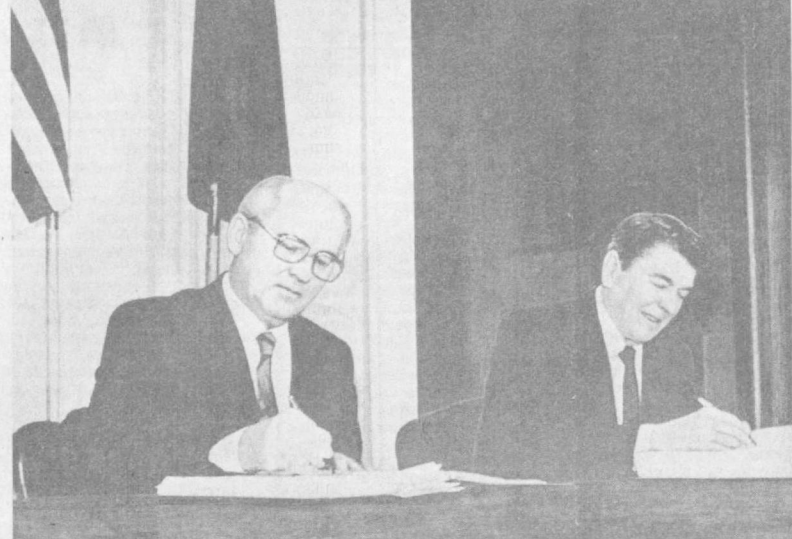
Во время подписания Договора.