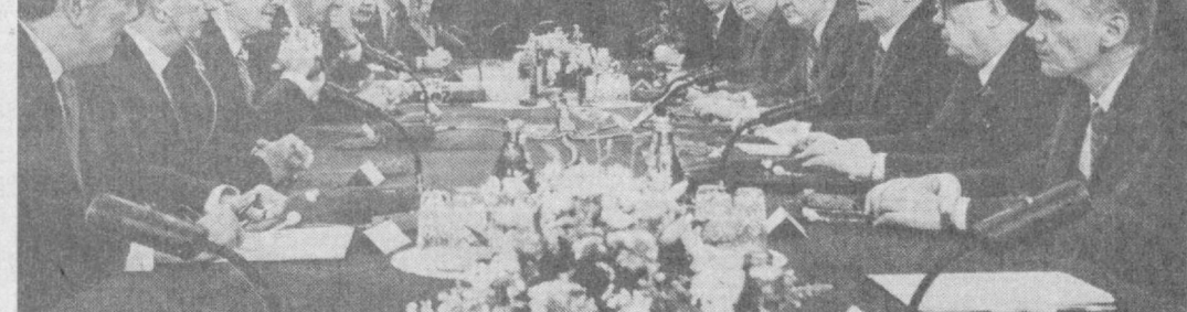
Во время встречи.

С советской стороны были член Политбюро ЦК КПСС, министр иностранных дел СССР Э. А. Шеварднадзе, член Политбюро ЦК КПСС, секретарь ЦК КПСС А. Н. Яковлев, секретарь ЦК КПСС А. Ф. Добрынин, заместитель Председателя Совета Министров СССР В. М. Каменцев, другие официальные лица.