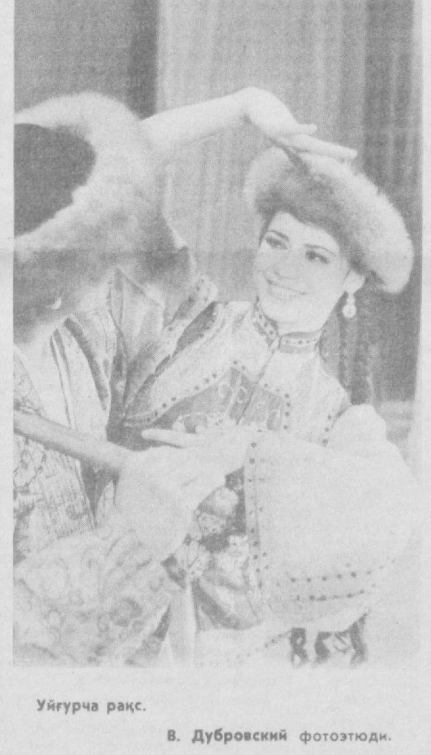
Уйғурча рақс.

Ҳайрат, таксиса са-ласида газетхонимизга омад қилиб боқибди. Аммо, Наусовлар оила-си билан бўлган воқеа-«Биз оғир касал қа-ррадишомизни кўргани каселхонча Бормоқчи ҳақида. Нарроқча яшил чирокларини ақиб, бўш такси турганини кўри-ди. Такси ёнида ёш йилит бир қиз билан гаплашиб турарди. Биз ундан «Сиз ҳайдоовчи-миз» деб сўрадик. У «йўқ» деб жавоб