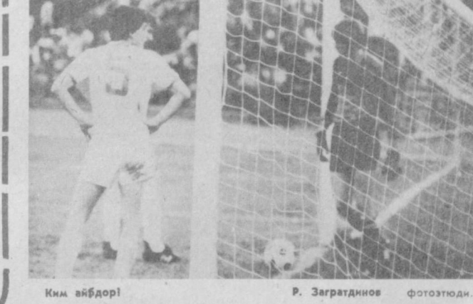
Ким айбдор!