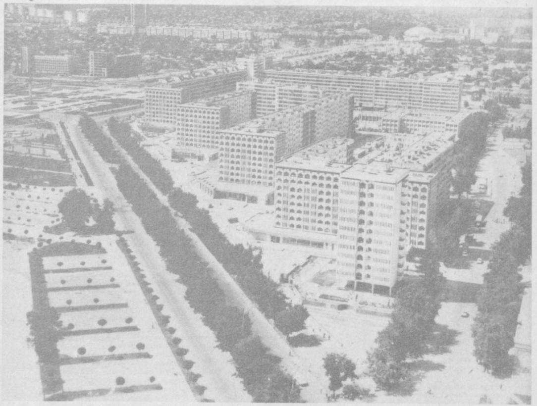
БУГУНГИ ТОШКЕНТ. ЭТАГА фотокроникаси.

Йиғилишда халқор кескинлик кучайган ҳозирги шароит-