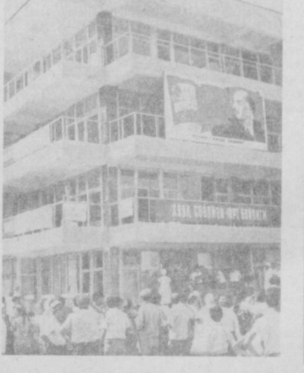
очилишига бағишланган иттигда Ўзбекистон Компартияси Тошкент шаҳар комитетининг биринчи секретари У. У. Умаров нутқ сўзламоқда; шифохона биносининг умумий кўриши.