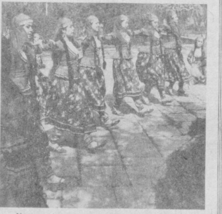
Қардошлик рақси.

Боболар Шом деган улкан, гўзал Тошкентсан, Ошнолар меҳрига тўлган, гўзал Тошкентсан, Дўстлик шаҳри деб ном олган, гўзал Тошкентсан, Жаҳон бўлган, бахти кулган, гўзал Тошкентсан. Бутун Шарққа ибрат, кўзгу, шу санаотинг, «Нон шаҳри» дейдилар, эзгу бу шарофатинг, Кўз-кўз қилиб яшар мангу эл, саодатинг. Жаҳон бўлган, Бахти кулган, гўзал Тошкентсан. Таърифинг шарҳи дил айлар бугун Баротинг, Қўшиқлари кўкка бўйлар, бўлсин қанотинг, Олам аҳли алқаб сўйлар, бўлсин қанотинг, Жаҳон бўлган, Бахти кулган, гўзал Тошкентсан.