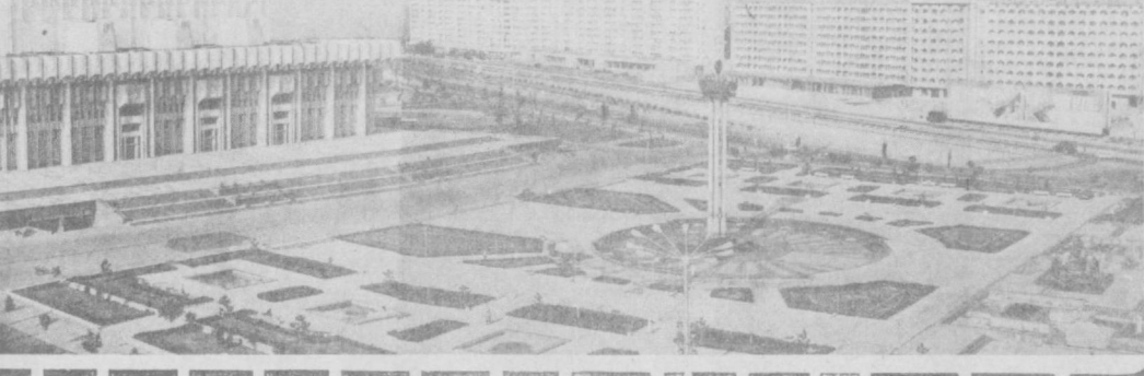
УМУМАН ЧИЛОНЗОР ҚУРИЛИШИ ШАҲАРСОЗЛИКНИНГ ЯНГИ ПРИНЦИПЛАРИ АСОСИДА ОЛИБ БЕРИЛДИ. БУ ЕРДА КЎЧАЛАРИНИ ЛИНИЯЛИ ПЛАНИРОВАКЛАШ ҲУНГА УЙЛАРИНИ МИКРОРАЙОНЛАРДА ЖАМЛАШ АМАЛАДА ЖОРИ ЭТИЛДИ.