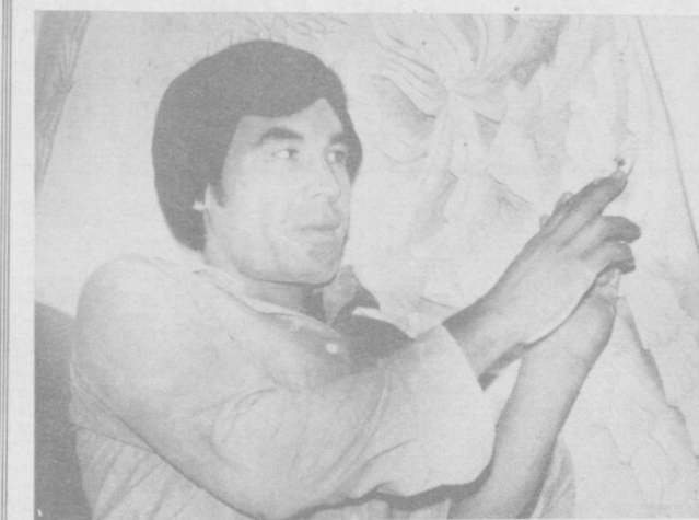
Шаҳримизда кўна меъморий обидалар кўп. Кейинги йилларда уларнинг катта қисми таъмирланиб, ўзининг иккинчи ҳаётини бошлади. Тошкент махсус илмий таъмирлаш ишлаб чиқариш устаносининг усталари бу ишда жиҳозлик кўрсатмоқдалар.