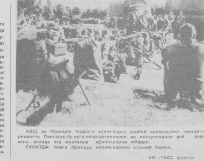
АҚШ ва Франция Чаддаги воқеаларга ҳарбий аралашувини неғайтиришпти. Пентагон бу ерга оғир артиллерия ва инструкторлар деб атагани, аслида эса мунтазам қўшинларни юборди. СУРАТДА: Чадга француз қўшинларини етказиб бериш.

● Туркияда дайди итлар ва мушуларни ўқиди тутишмоқда. Сабабимиз маълуматда минглаб кутуриш соқлари қайда этилган, кўнада ҳар хил ҳайвонлар билан тўқнашувдан сўнг вакцинация қилиш илтимоси билан докторларга мурожаат қилганлар касаллар сонини нисбатда кўпайиб кетган. «Улар ҳатто ўрдақ чўрса ҳам бизга ердан ўраб мурожаат қилишяпти», — дейишди киникно билан врачлар. Қутуриш ит ва мушулар бақилласи билан захарланган беморларнинг қандай азоб чекаётганлигини акс эттирувчи кўплаган рангли суратларнинг турли журналларда кўплаган босилганлиғи шаҳарликлар ўртасида ● Коҳирада кўплаган тушган тўрт қаватли бинонинг айроноларини остида қолган ўн беш киши ҳалок бўлган, ўн олти киши ярадор бўлган. Тўла яроқсиз қонга келган эски кино нураш вақтида унинг ҳар икки томонидagi бино ҳам қулаган. Миср пойтахтида ҳозир авария ҳолатидаги 40 минга яқин турар жой бинолари бор. ● Австрия газеталарида хабар беришга штирияди ҳарбий учувчиларни ўрғатиш вақтида фалокат содир бўлган. Бир мототриль самолёт ер юзига бўлаб пастлаб учайтганда бошқарши жиҳозлар ишламай қолди, Энс дарёсига қўлаб тушган. Тахмин қилишларига қараганда машина қулашдан олдин қочорни куч қилишган тоқ ўтайтган сикига тегиб кетган. Бу сўнги икки йил ичда Австрияда ҳарбий учувчиларнинг машқлари вақтида содир бўлган иккинчи ана шундай ҳодисадир. Бу савфар кўрсатиш билан бирга катта тажрибага эга бўлган тахник инструктор ҳам ҳалок бўлган.