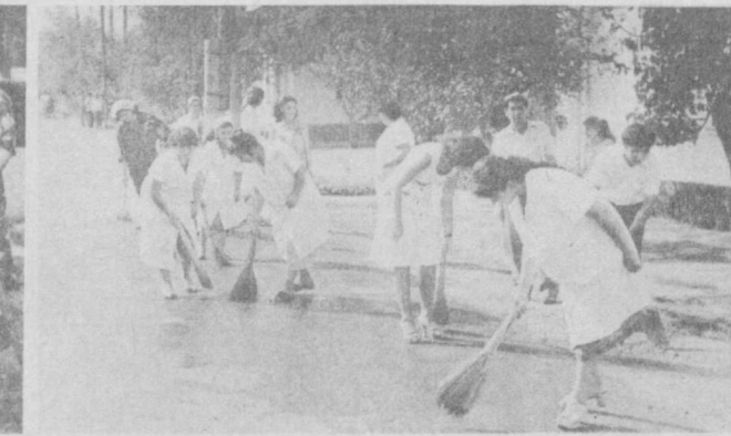
СУРАТЛАРДА: Фрунзе районидеги Черешнев кўчаси ва Собир Раҳимов районидеги Абдураҳмонов кўчаларидаги умумхалқ ҳашарлари.