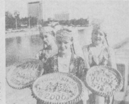
ражада ўзгарган Тошкент мармар жылдоси билан товланиб турган ноёб ишюотлари билан гўзал. Уни халқ усталари, расомлари, архитекторлари, қурувчилари яратилган. Қўш учар баландликдан олинган «Москва»

150 сурат Ўзбекистон тарихи билан таништирди. Тошкентнинг кўп асрлик тарихи ҳақида ҳикоя қилувчи археологик қазилмалар ҳақидаги кадрлар, университетнинг эски бйноси, «Воскресенск бозори», Меҳнат саройи ва бошқа жойларни кўргазма 1966 йилда шаҳарда юз берган энгилла оқибатини бартараф этиш учун мамлакатнинг ҳамма еридан ёрдам келди. Талай суратлар ўша машаққатли кўнлар ҳақида эслатиб ўтади. Бугунги кунда қиёфаси таниб бўлмас да