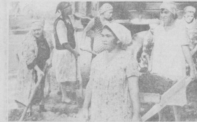
СУРАТЛАРДА: Фрунзе районидеги Черешнев кўчаси ва Собир Раҳимов районидеги Абдураҳмонов кўчаларидаги умумхалқ ҳашарлари.