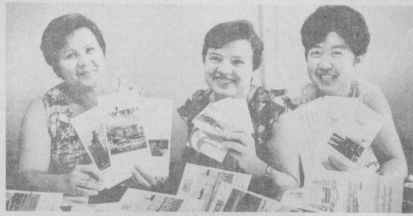
СУРАТДА: Ўзбекистон Компартияси Марказий Комитети Наشرётининг юбилей рамиш тўширилган маҳсулотлари.

Ҳукуматнинг кўрсатмасига мувофиқ 1983 йил 1 сентябрдан бошлаб давлат ва кооператив савдоси чанана тармоғида молларни пайсайтирган нархларда мавсумий сотиш ўтказилди. Бундай моллар жумласига енгил санаянинг кўпгина турдаги маҳсулотлари, шунингдек маданий-маиший буюмлар ва рўзгор асбоблари — жами 3 миллиард сўмлик мол киритилди. Бу моллар доимо савдо қилинадиган университетлар, ихтисослаштирилган магазинларнинг ўзида ва бошқа савдо корхоналарида сотиладди.