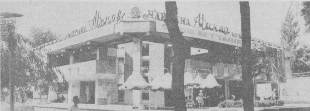
СУРАТДА: «Чинор чойхонаси».