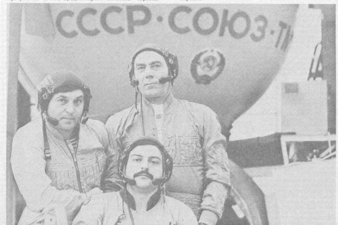
НА СНИМКЕ: первый экипаж космического корабля «Союз ТМ-4» (слева направо) — командир экипажа летчик-космонавт СССР Владимир Георгиевич Титов, бортинженер Муса Хираманович Манаров и космонавт-исследователь, заслуженный летчик-испытатель СССР Анатолий Семенович Левченко в Центре подготовки космонавтов имени Ю. А. Гагарина.

«Союз ТМ-4» с научно-исследовательским комплексом «Мир». В ходе совместного полета будет произведена замена экипажа орбитального комплекса «Мир» — космонавтов Юрия Романенко и Александра Александрова, длительное время работающих на орбитальной орбите. Бортные системы корабля «Союз ТМ-4» работают нормально. Самочувствие товарищей Титова, Манарова и Левченко хорошее.