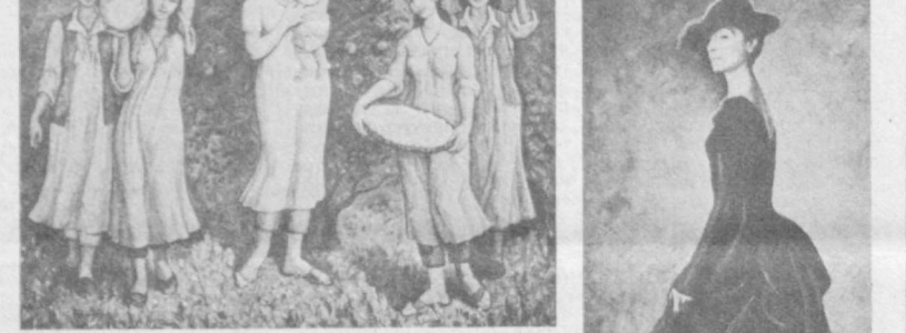
В Выставочном зале Союза художников Узбекистана развернута выставка, посвященная 60-летию движения «Худжум».