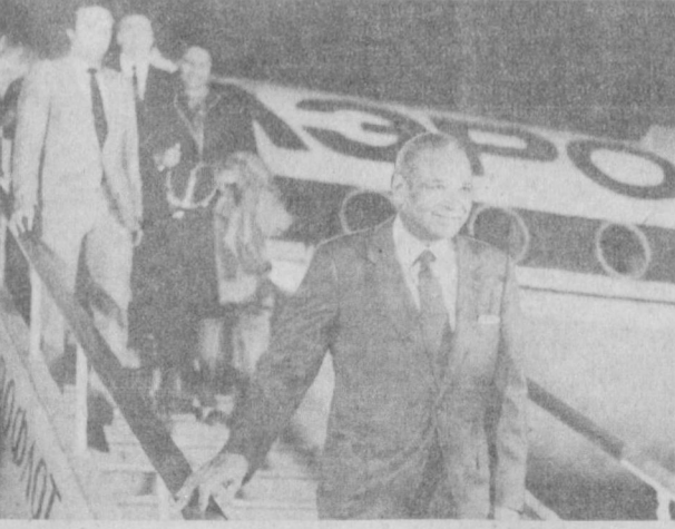
Тошкент. 7 сентябрь, 1983 йил. ЮНЕСКО бош директори Амаду Махтар М'Боунинг Тошкент аэропортида кутиб олиниши.

Бирлашган Миллатлар Ташкилотининг маориф, фан ва маданият масалалари билан шуғулланувчи ташкилоти (ЮНЕСКО)нинг бош директори Амаду Махтар М'Боу 7 сентябрь кунин Тошкентга келди. У Совет ҳукуматининг таклифига биноан мамлакатимизда меҳмон бўлиб турибди. Тошкент аэропортида А. М. М'Боуни СССР Ташқи ишлар министрининг ўринбосари, СССРнинг ЮНЕСКО ишлари комиссияси раиси В. Ф. Стукалин, Ўзбекистон Компартияси Марказий Комитетининг секретари, Ўзбекистон ССР Олий Советининг ташқи ишлар бўйича доимий комиссияси раиси О. У. Салимов, Ўзбекистон ССР Министрлар Совети Раисининг ўринбосари М. Т. Турсунов, Ўзбекистон ССР ташқи ишлар министри Б. А. Абдуразақов, Тошкент шаҳар ижроия комитетининг раиси В. О. Қозимов, жамоатчилик вакиллари кутиб олдилар. Кутиб олувчилар орасида СССР ташқи ишлар министрининг Тошкентга келган ўринбосари, ЮНЕСКО ишлари юзасидан СССР комиссиясининг раиси В. Ф. Стукалин, ЮНЕСКО коммуналқияларини ривожлантириш халқаро программаси ҳукуматлараро кенгашининг тўртинчи сессиясида қатнашган делегацияларнинг аъзолари ҳам бор эди. (ЎзТАГ).