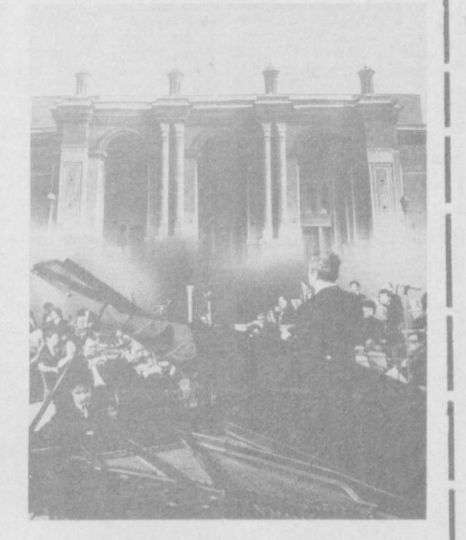
Бугунги Тошкентда маданият исми кўр-рилмаган даражада гуллаб-гилмоқда. Бу ерда Давлат санъат музейи, картиналар