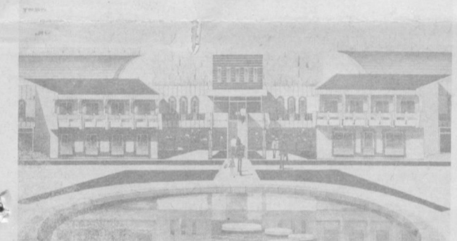
Чирчиқ дарёси соҳилида табиати муҳофаза қилиш комплекси бўйбун эрилмақда.