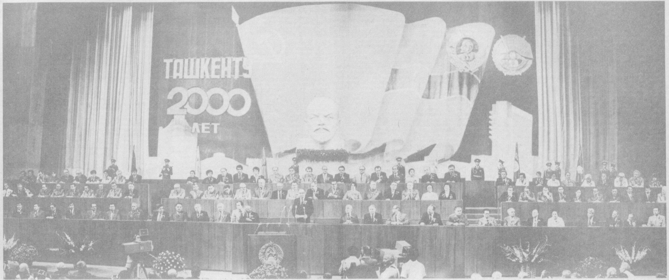
Тошкентнинг 2000 йиллигига ҳамда шаҳарга Ленин ордени тошхирқлигига бағишланган тантанали йиғилиш президуми.