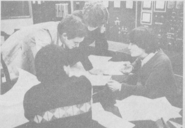
ЗАМОНДОШИМИЗ БИЛАН БИР КУН