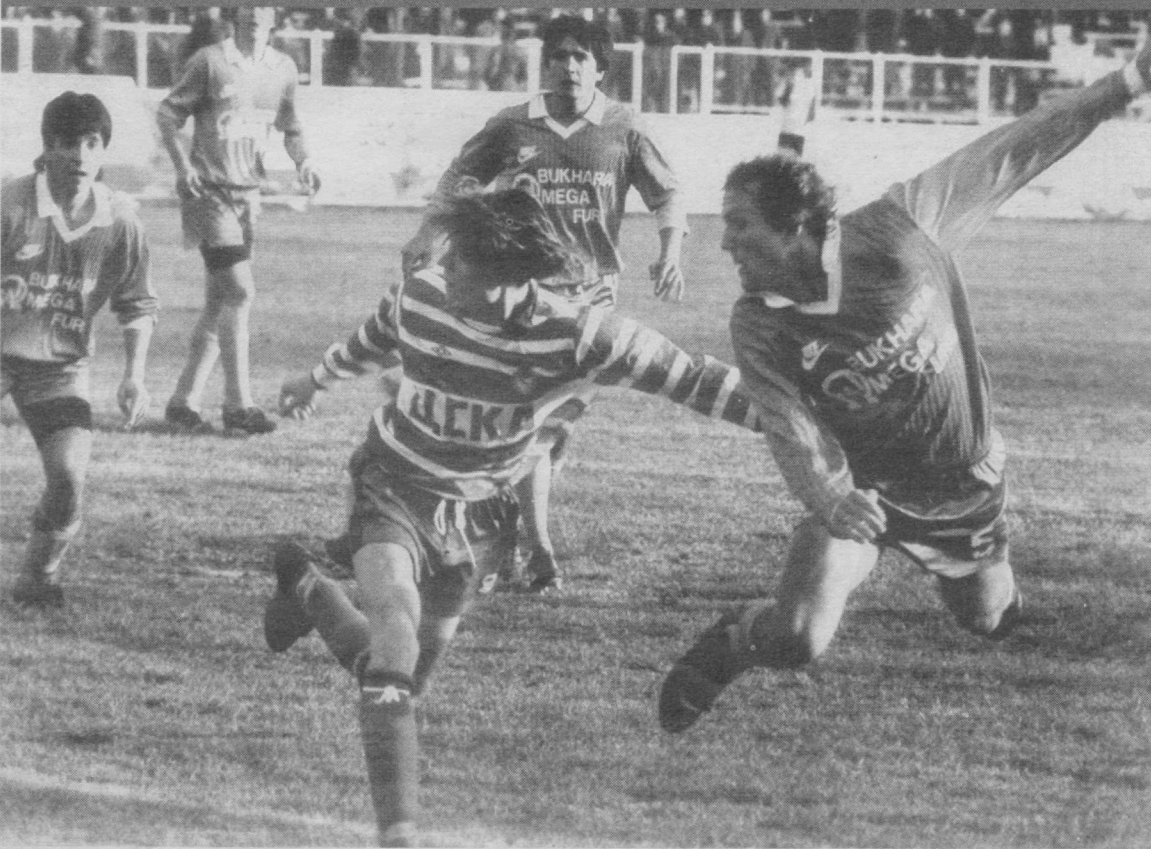
Последний раз «Пахтакор» и ЦСКА играли друг с другом в 1991 году в 1/8 финала Кубка бывшего СССР. На снимке Дмитрия Михайлова первый матч этих клубов в Ташкенте, завершившийся вничью - 1:1.