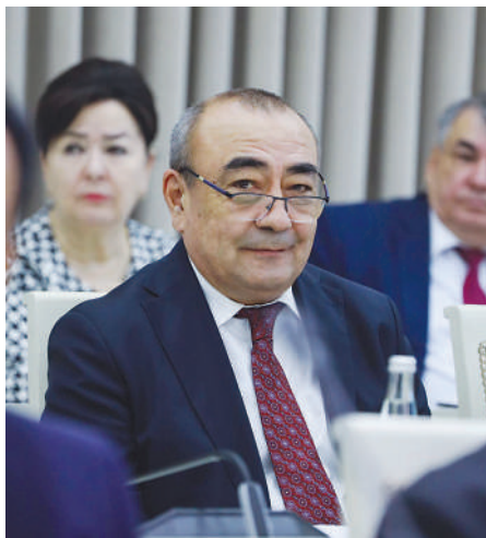
Хусан ЭРМАТОВ, Олий Мажлис Сенати аъзоси:

— «Ўзбекистон-24» телеканалда «Ахборот»ни кўриб беҳад таъсирландим. Президент аҳолининг ижтимоий муҳофазага муҳтож қатламлари билан ишлаш тизимини бутунлай янги тизимга ўтказиш борасида соҳа мутасаддилари билан таҳлилий йиғилиш қилиб, уларга бу борадаги вазифаларни белгилаб берди. Бу охириги тўрт йилда Президентимизнинг кун тартибидеги бош масалалардан бири бўлиб, келаётган йилда мамлакатда камбағалликни қисқартириш мавзуси, назаримда, тизимли ислохотларнинг мантиқий давоми билан натижадорликда ҳам мазмун ва ҳам мундарижа билан бойимокда.