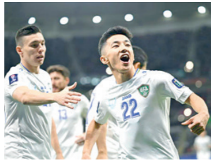
ФИФА 2024 йилги сўнги ЯНГИЛАНГАН РЕЙТИНГИДА Ўзбекистон терма жамоаси 58-ўринни эгаллади.