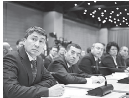
Президентимиз фармацевтика соҳасидаги корхоналар раҳбарлари билан МУЛОҚОТ ҚИЛДИ.