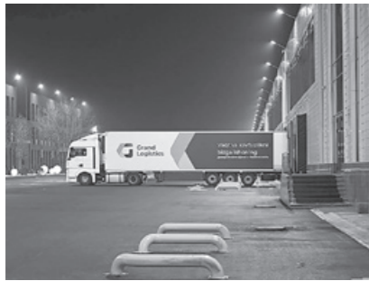
Шавкат Мирзиёев Зангиотада фармацевтика маҳсулотлари учун ЙИРИК ЛОГИСТИКА МАРКАЗИНИ бориб кўрди.