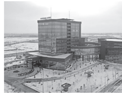
Шавкат Мирзиёев “TASHKENT PHARMA PARK” инновацион илмий-ишлаб чиқариш фармацевтика кластери билан танишди.