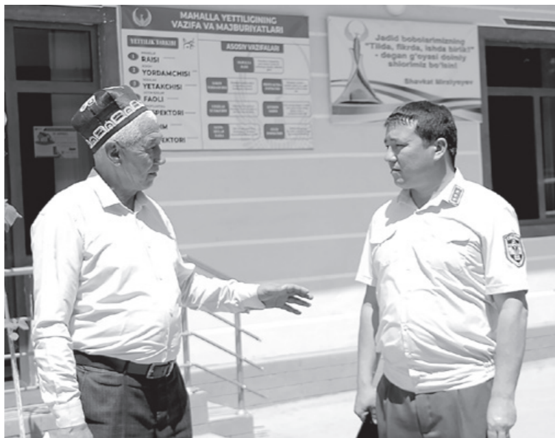
олдиндан белгиланган имкон беради.

Онлайн чеклар орқали қайси ҳудудда қандай дориларга талаб кучайганига қараб, касалликларнинг олдини олишга қарши тезкор қарор қабул қилиш имконияти мавжуд. Бу яқин келажакда ҳар бир маҳсулот бўйича истеъмол эҳтиёжи ҳақидаги маълумотларни таҳлил қилиш имкониятини яратди. Бу эса бюджет маблағлари тақсимотида аҳоли эҳтиёжига қараб, истеъмол товарлари импорт-экспорти, ишлаб чиқариш ёки етиштириш ҳажминини