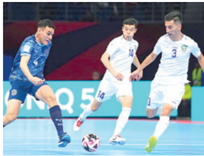
Ўзбекистонда алоҳида ФУТЗАЛ ФЕДЕРАЦИЯСИ ташкил этилади.