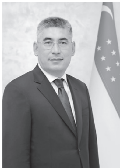
солиқ инспекторлари “маҳалла бюджет”ни ошириш учун нималарга кўпроқ эътибор қаратиши зарур, деб ўйлайсиз?

Айни пайтда республикамиздаги мавжуд 9 452 та маҳаллага 4 324 нафар солиқ органи ходими бириктирилган. Уларнинг асосий вазифаси – ҳудуддаги норасмий тадбиркорлик фаолиятини қонунийлаштириш, ўзини ўзи банд қилганларга кичик бизнес тоифасига ўтишга кўмаклашиш, тадбиркорларни қўллаб-қувватлаш орқали уларнинг фаолиятини кенгайтириш ва даромадларини ошириш, шунинг ҳисобидан солиқ базасини кўпайтиришдан иборат.