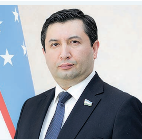
Мухсинжон ХОЛМУҲАМЕДОВ, Олий Мажлис Қонунчилик палатаси депутати, O'zLiDeP фракцияси аъзоси

зилма ва коммунал хизматлари яхшиланди. Ҳозирда барча мактаблар электр энергияси, интернет, стол компьютерлари ва асосий санитария шароитлари билан таъминланган. Уларнинг аксарияти, яъни 84 фоизи мактаб ҳудудида сувдан фойдаланиш имкониятига эга. Ушбу ўзгаришлар қўллаб-қувватлаш учун ижобий тараққиёт ва яхшиланган ҳаёт сифатини англатади.