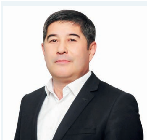
Нуриддин ЖАББОРОВ, Олий Мажлис Қонунчилик палатаси депутаты, О'zLiDeP фракцияси аъзоси

Албатта, бу жараён аҳолига, айниқса, кам таъминланган, ёшлар, қариялар, ногиронлар ва бошқа ёрдамга муҳтож қатламларга давлат томонидан кўрсатиладиган ёрдам ва хизматлар тизими узлуксиз давом этверишини аниқлатади. Бу эса давлатнинг ижтимоий-иқтисодий сий-