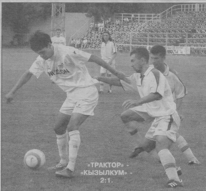
«ТРАКТОР» - «КЫЗЫЛКУМ» - 2:1.