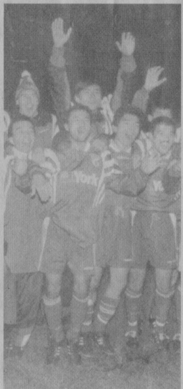
1997 год. Обладатель Кубка Узбекистана.

Мне очень хотелось, чтобы «Пахтакор» всегда был на высоте. Первые годы независимых чемпионатов для этой команды складывались непросто. Финансовые трудности, отсутствие стабильности в органи-