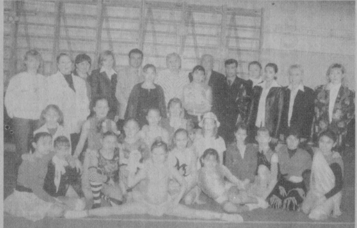
Уже в ранге руководителя РКОР.