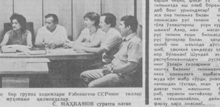
Узбек Совет энциклопедиясининг бир гурупа ходимлари Ўзбекистон ССРнинг тиллар тўғрисидаги қонуни лойиҳасини муҳокама қилмоқдалар.