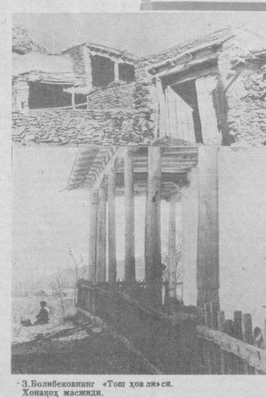
З.Болибековнинг «Тош ҳовли»си. Хонақоҳ масжиди.

Мен қишлоқ қурилиши ва меъморчилиги тарихига оид қўлаб материаллар тўпла-дим ва бир неча илмий мақолалар тайёрладим. Уларни имконин бори-ча тез-фурат ичиди бо-сиб чиқаришга ҳаранат қиламан. Умуман, Гараша қишлоғи ҳали чўқур тадиқ этилиши ва тарихий топилма-лар, археология кашфиётлар учун асос бўлишига ишон-чим қилим.