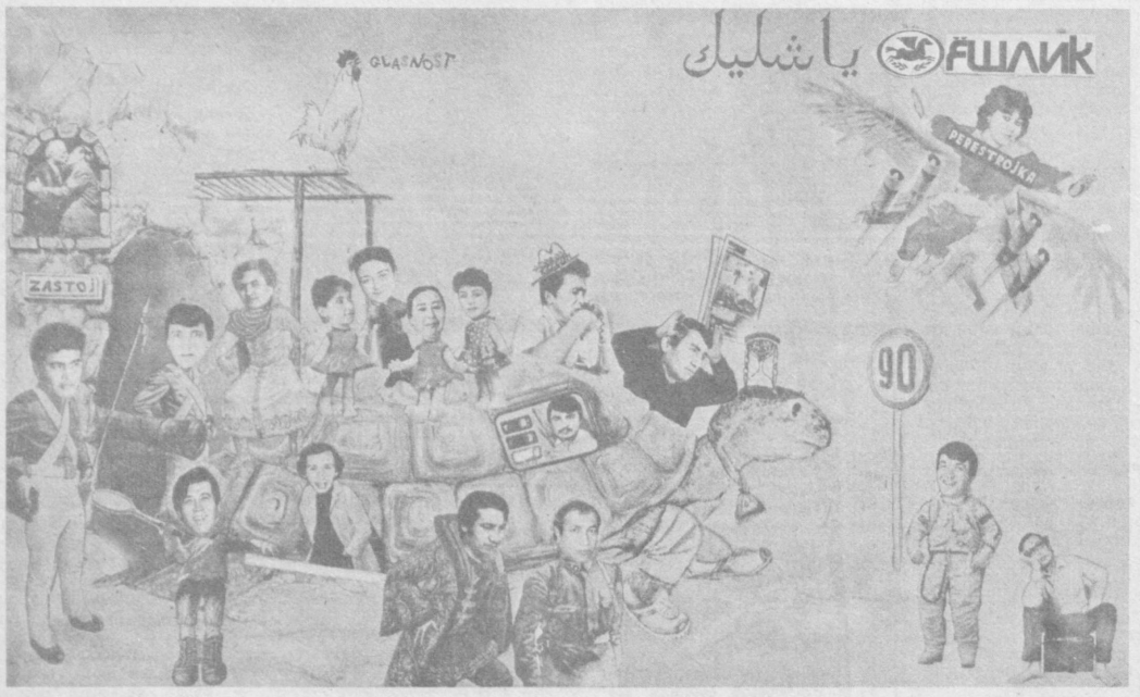
— Биз мамлакатнинг суръатидан жиндай тез кетяпмиз, холос...