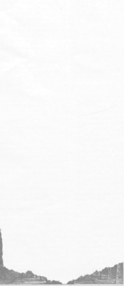
Рассом И. Ҳайдаров асарларида намуналар.