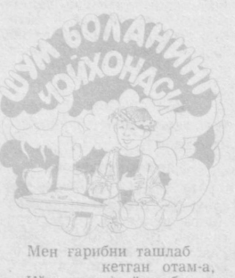
Мен габири ташлаб кетган отам-а, Қўзларимни ёшлаб кетган отам-а...