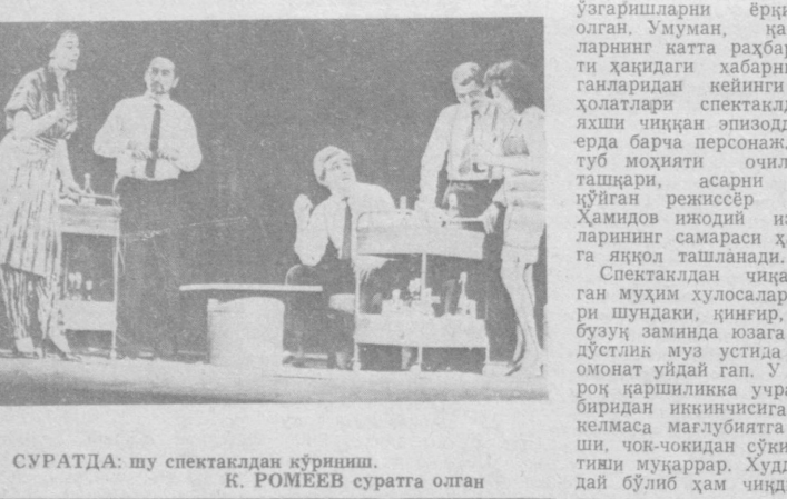
СУРАТДА: шу спектаклдан кўриниш.

ПУЧ. СПЕКТАКЛИДА драматург Абдуқадир Бреховнинг «Мухоммад» асари... АСАД ДИЛМУРОД