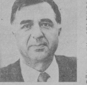
Агар адабий таъкидчил халқнинг катта адабиётнинг эълитборни тортаётган экан...