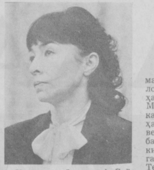
Хурматли ўртоқлар! Сийёсий маъруза атрофида...