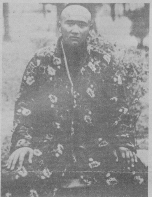
Абдулла Қодирий. Нобб сурат.