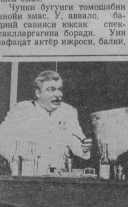
М. Горький номидаги Тошкент Давлат академик рус драма театрининг «Устаси фаранг» спектаклидан кўриниш.

Бироқ ҳеч қайси М. Горький номидаги Фарғона область музыкали драма театри спектакли даражаси кўтарилган эмас. Моҳир драматург ва режиссёрларнинг ижодий ютуқлари ҳисобланган Санъ Аҳмадининг «Не-воҳидовнинг «Олтин девор» асарлари ҳамон томошабин тилидан ташланган қўямиз. Уларнинг сафига Саид Аҳмадининг «Фармонбин араз-лади» асари ҳам қўшилди.