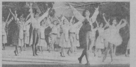
СУРАТДА: II фестивалда намоиш этилаётган, Қамза номидagi академик театрнинг «Пуч», «Еш гвардия» театрнинг «Паражик сирлари», Навоий номидagi академик театрнинг «Чиполлино» спектаклидани кўришчилар.