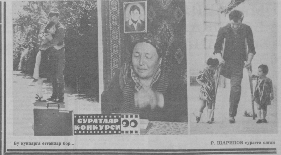
Бу кунларга етганлар бор...

МУХБИР: — Бунақада пудратчи қурилиш ташиқлотларининг деярли ҳаммасини судга бериш ва хонавайрон қилиш мумкинми-ку!