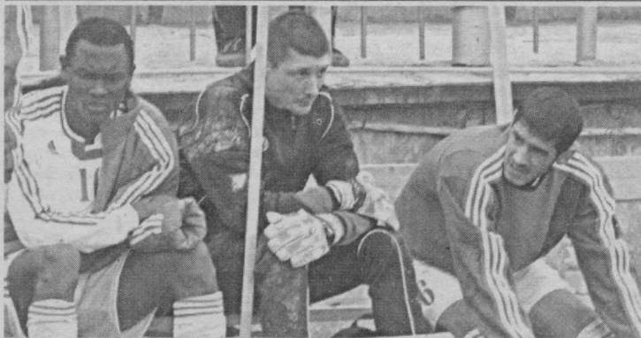
Читайте на 2-й стр.