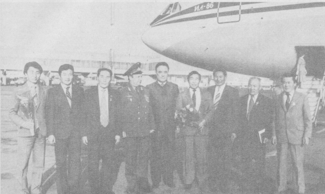
Монголиялик меҳмонларни кутиб олиш пайти.