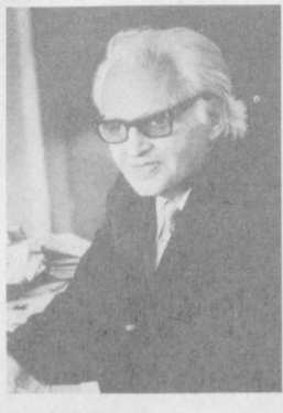
Фулом Раббоний Тобон «Тошкент оқшом»и редакциясига ҳам таширф буюрди, бир неча саволларимизга жавоб берди.

Хиндистон тараққиётпарвар ёзувчилар уюшмаси президиумининг раиси, ҳозирги замон ҳинд адабиётининг йирик наомандларидан бири, оташин шоир ва таниқли публицист Фулом Раббоний Тобон Осие ва Африка ёзувчилар бирдамлик ҳаракатининг асосий иштирокчиларидан бири. У Хиндистон Республикасининг энг юксак «Пада Шур» Давлат муқофотида ҳамда «Муди Голби» ва Жавоҳарлал Неру муқофотларига сазовор бўлган.