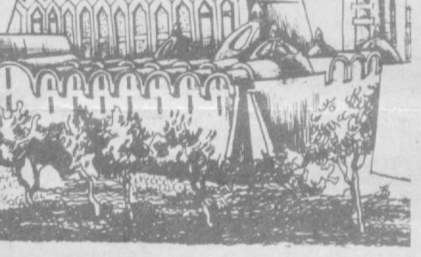
Тошкентнинг Чорсу маҳалласи тепалигида қурилган ҳаммом

Ҳаммом қурилиши ҳақида эътибор берилмоқда. Жумладан, қадимги аъёнлар асосида қурилган ор-осида иссиқ каналли ҳаммомларни Фарғона, Сирдарё, Тошкент ва бошқа областларда ҳам қўраимиз. Мазкур ҳаммомларда иссиқ пархоналар поли ер-ости каналлари орқали иситилган. Мазкур ҳаммомларнинг ташқи томони мозаик қоплам билан ҳашамланган.