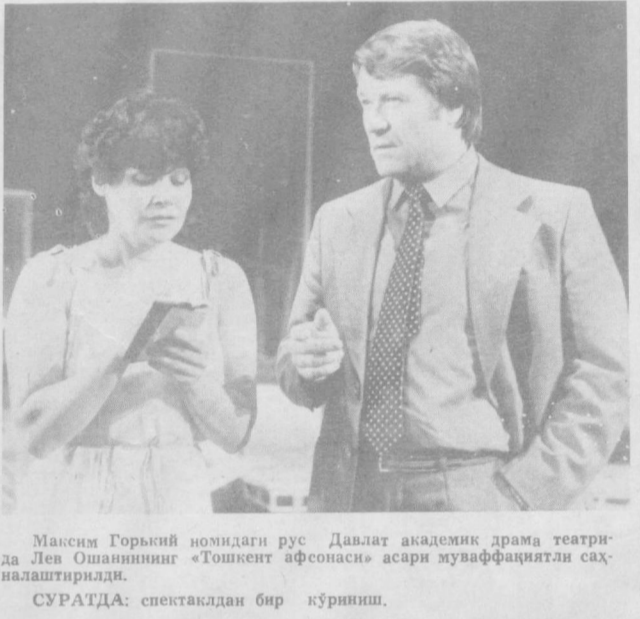
Максим Горький номидаги рус Давлат академик драма театрида Лев Ошанининг «Тошкент афсонаси» асари муваффақиятли сахналаштирилди.