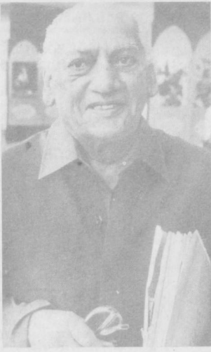
Лаган бошқа бир сурагда улкан шарқ шoirи билан атқолиб...