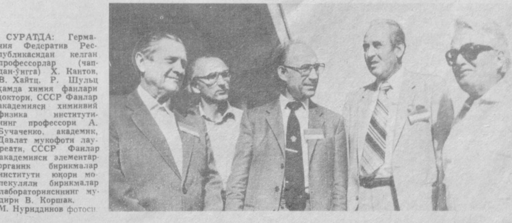
СУРАТДА: Германия Федератив Республикасида келган профессорлар (чапдан-ўнга) Х. Кантов, В. Хайтц, Р. Шульц ҳамда химия фанлари доктори, СССР Фанлар академияси химиявий физика институтининг профессори А. Бучаченко, академики, Давлат мукофоти лауреати, СССР Фанлар академияси элементар органик бирикмалар институтининг доктори В. Коршак, М. Нуридиновнинг фотоси.

Тошкентда бўлиб ўтган бу симпозиум биз учун полимер фани соҳасида тажриба ва ютуқларни алмашиш мактаби бўлди. Китобдан ўқиб биопроблемалар хусусида кашфиётларининг муаллифлари билан мулоқом қилиш аса бутунлай бошқа гап.