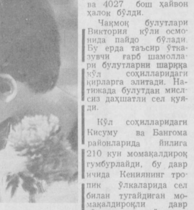
М. Нурриднов фототюди.

Бир куни кафе ёнида бир дўстимни учратиб қолдим: — Кечкурун нима қилмоқчисиз? — сўрадим мен.