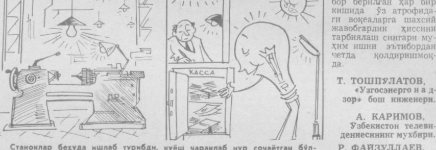
Станоклар беҳуда ишлаб турибди, қуёш чарақлаб нур сочяётган бў-лада чироқлар ўчирилган. Ана шунинг айтадиларда халқ мулкига хўжасизликка мўносават деб.