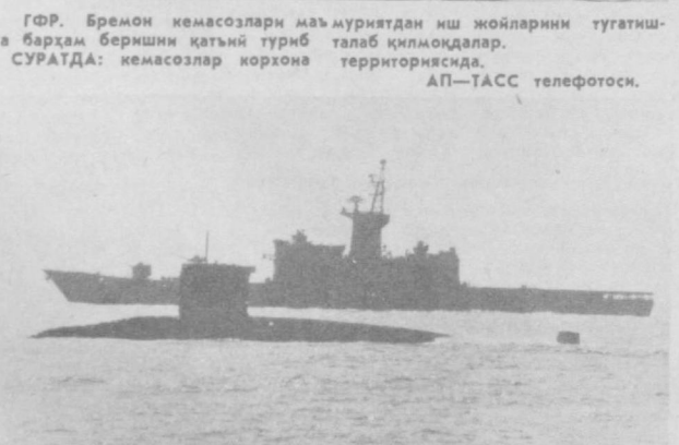
Япониянинг ҳўқмор доиралари ва ҳарбий маъмурият қуроли қулчлари зўр бериб тўпламоқда. Япония ўз ҳарбий-деғиз потенциал-ини АҚШнинг актив иштирокида кучайтирмоқда. СУРАТДА: Япониянинг «ўз-ўзини мудоффа қилиш кучлари»нинг жанговар кемалари рейдада.