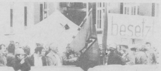
ГФР. Бремон кемасозлари маъмуриятдан иш жойларини тўғатиш-га барҳам беришни қатъий туриб талаб қилмоқдалар. СУРАТДА: кемасозлар корхона территориясига.

ВЬЕНТЬЯН. Халқ Ласининг энг катта магистралаи — 9-сон миллий йўл қурилиш-ида навбатдаги участ-ка фойдаланиш учун топирилди. У бутун республика територия-си бўйлаб қарбдан шарққача ва сўнгра Вьетнамнинг соҳилигача етиб бора-ди. Энг асосий транс-порт йўлини барпо этишда йўл қурилиш-ининг асосий кучлари ишламоқда. Бу йўл мамлакатнинг қардош Вьетнам портларига етиб боришини таъ-минлайди, халқ хўжа-лигини хом ашё, ёқил-