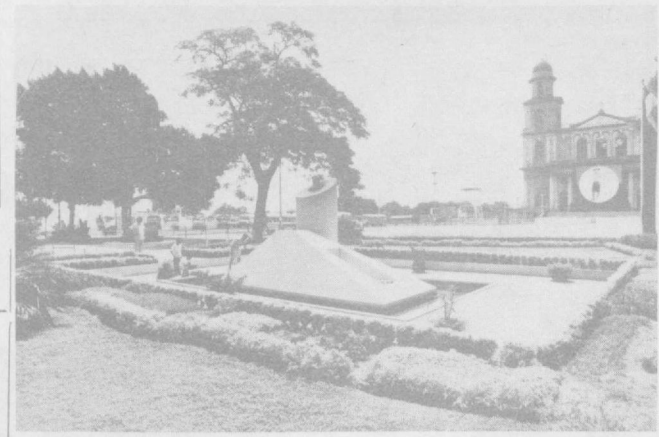
СУРАТДА: Сандиночи миллий-озодлик фронтининг асосчиси ва раҳбарлардан бири — Карлос ФONSEКА Амадорга ўрнатилган ёдгорлик олдиди.