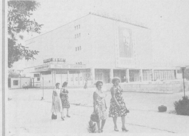
СУРАТЛАРДА: Чилонзор районида жойлашган кўркак хирургияси илмий тектириш институти ва «Ватан» кинотеатрини кўриб турибсиз.