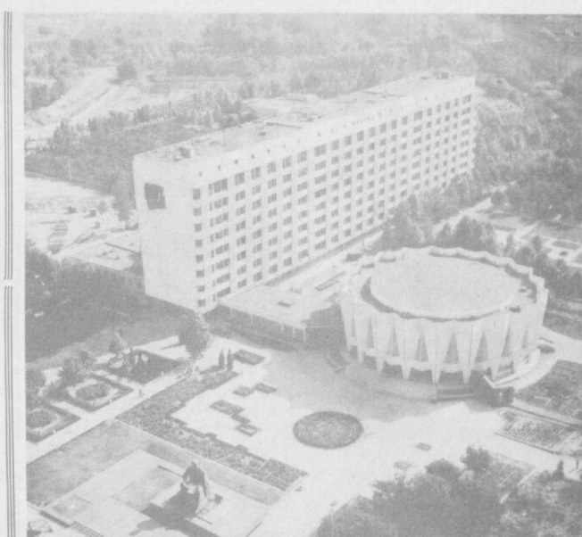
Шаҳримиз йил сайи оқибат ва кўркам бўлиб бормоқда. Бу ерда кўп-кўп турар жой бинолари, маданий-маънавий объектлар қад кўтарилди. Янгидаги пайда бўлаётган қарлар ва хибоблар Тошкентимиз ҳуснига қўшиб қўймоқда.

жасида ҳам келиб чиқади. Кўпчилик олимлар сўнги йилларда ўпка рақининг кўп учрашига атмосфера ҳавосида чанг ва зарарнизига ниҳоятда зарарли эканлиги ҳамама маълум. Чекши пайтида тўтун ўпкага қиради, у ерда майда қон томирлар-капилляри, чекши билан ўпка рақи ўртасида аниқ боғланиш борлиги аниқланди. Ўпка рақи чекувчилар орасида чемайдиغانларга нисбатан 15—20 марта кўп учрайди. Маълумотларга қўра, беморларнинг 90 процентидан кўпроги кашандалардан иборат. Айниқса, бу касаллик спиртли ичимликларни суинишмол қилган алкоғоликларда ҳам кўп учрайди.