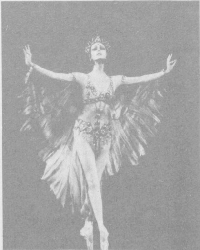
СУРАТЛАРДА: ССР Иттифоқи Катта театрининг «Ҳинд достони» балетидан сахналар.