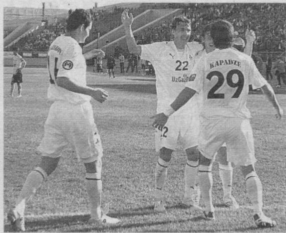
Читайте на 2-й стр.

Узбекистанские клубы в первом туре свои матчи проиграли. Хотя, выглядели в этих матчах ничуть не хуже своих соперников, а гол в свои ворота пропускали на последних минутах. Зато, во втором туре им удалось порадовать болельщиков.