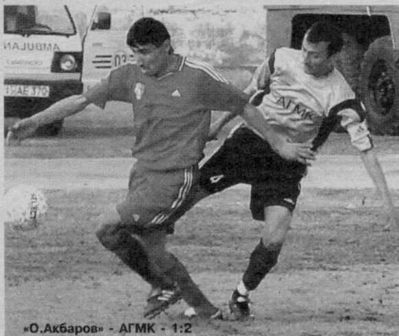
«О.Акбаров» - АГМК - 1:2