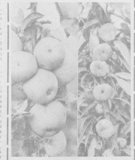
Оқтин куз неъматлари.

Лойхўрликнинг пазандалик таъсири биз қадимги японлар, Судандаги берберлар мисолида кўриб ўтдик. Саҳройи Кабирдаги яна бир қўлчанчи қабилани туп-тупини пўстини еб қўйди. Бу касаллик ҳисобланиб, ўтмишда гилбута дори сифатида ишлатилган, эндиликда шу мақсадда аптекаларда сотиладиган калцийнинг глюконати таблеткалари, ишлатилади.