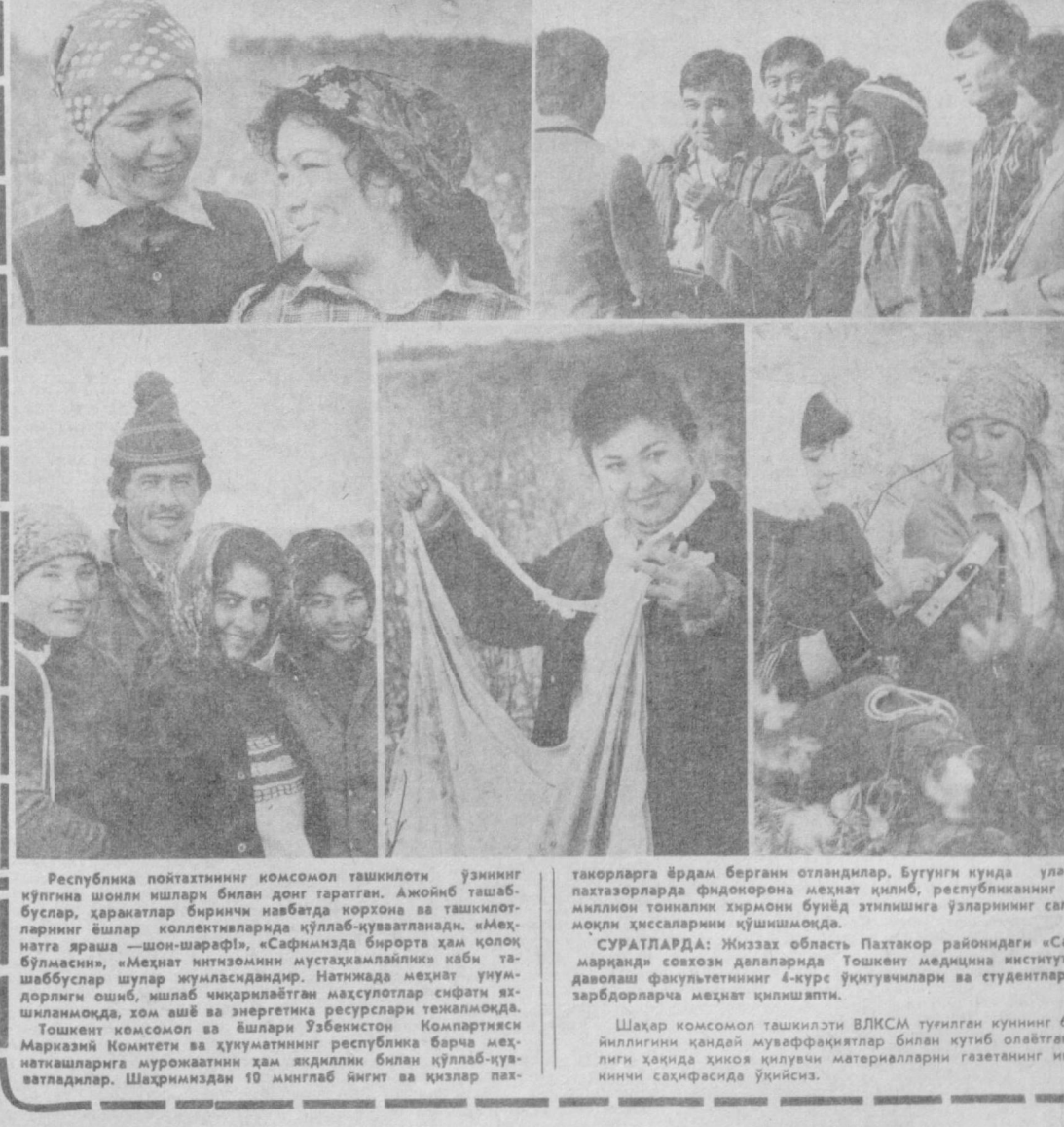
Республика пойтахтининг комсомол ташкилоти ўзининг кўпгина шонли ишлари билан донг таратган. Ажойиб ташаббуслар, ҳаракатлар биринчи навбатда корхона ва ташкилотларнинг ёшлар коллективларида қўллаб-қувватланади. «Меҳнатга яраша — шон-шарофат», «Сафимизда бирорта ҳам қолқ бўлмасин», «Меҳнат интизомини мустаҳкамлашлик» каби талош-табибуслар шулар жумласидандир. Натинида меҳнат умулдорлиги охиб, ишлаб чиқарилаётган маҳсулотлар сифати яхшиланмоқда, хом ашё ва энергетика ресурслари тежалмоқда. Тошкент комсомол ва ишлари Ўзбекистон Компартияси Марказий Комитети ва ҳукуматининг республика барча меҳнатқилларига муружоатини ҳам яқдиллик билан қўллаб-қувватлади. Шаҳримиздан 10 минглаб йигит ва қизлар пахтакорларга ёрдам бергани отландилар. Бугунги кунда улар пахтазорларда фидокорона меҳнат қилиб, республиканинг 6 миллион тонналик хирмони бунёд этилишига ўзларининг салмоқли ҳиссаларини қўшишмоқда.

Ўзбекистонда меҳмон бўлиб турган Чехословакия Компартияси Марказий Комитети аъзоларига кандидат, ЧКП Марказий Комитети маориф ва фан бўлими мудирининг ўринбосари Милослав Доцкал Тошкент давлат университетини ҳузурдаги ижтимоий фанлар ўқувчилари малакасини ошириш институтида Чехословакия Компартиясининг ёшлар ўртасида олиб бораётган ишлари тўғрисида лекциялар ўқиди.