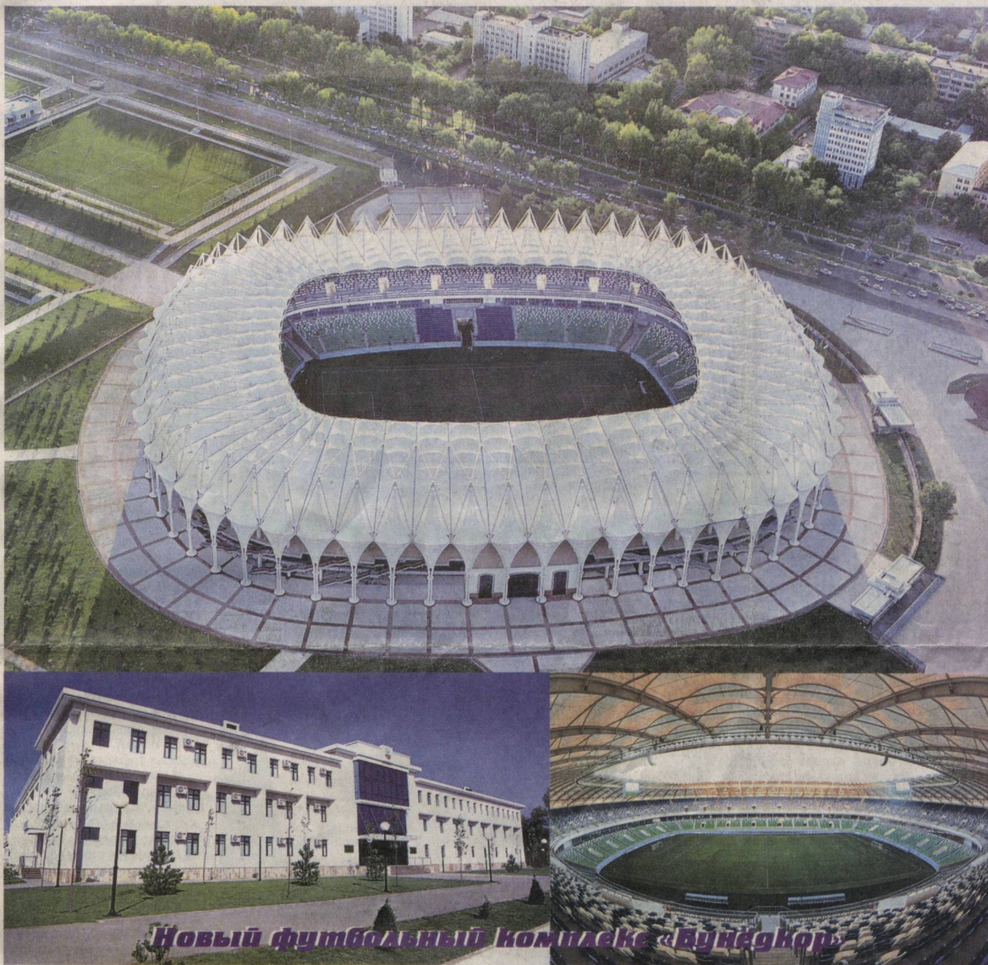
Новый футбольный комплекс «Бунёдкор»

Президент Республики Узбекистан Ислам Каримов 29 августа ознакомился с созидательной работой, осуществляемой в городе Ташкенте.