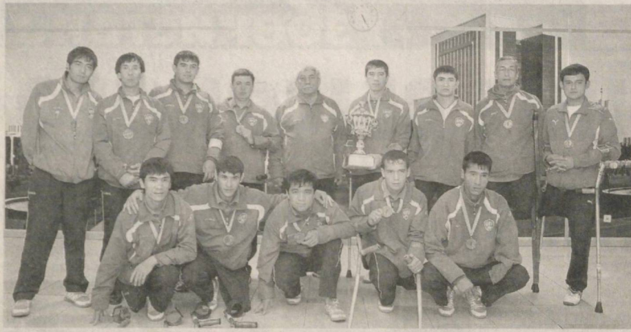
Окончание. Начало на 1-й стр.

Узбекские футболисты обыграли команду Турции со счетом 6:1, Японии - 7:0, Либерии - 8:2, Англии - 4:2, Украины со счетом 4:0 и заняли первое место в группе «В». В полуфинале наши футболисты забили четыре безответных мяча в ворота сборной Аргентины - финалиста чемпионата мира 2010 года. В финале наши соотечественники сыграли против хозяев и, победив со счетом 1:0, стали чемпионами мира в третий раз. Указом Президента группа членов сборной команды инвалидов-