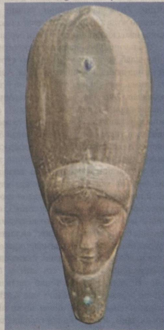
Уzun бош кийимли қиз (1966).

Пойтахтимиздаги "Наврўз" этнография боғида "Кулоллар сайли" миллий кулолчилик махсулотлари аукцион савдоси ташкил этилди. Ўзбекистон Республикаси Президентининг 2021 йил 23 мартдаги "Кулолчиликни жадал ривожлантириш ва қўллаб-қувватлаш чора-тадбирлари" тўғрисидаги 5033-сонли қарори ижроси доирасида Республика "Хунарманд" уюшмаси ҳамда Савдо-саноат палатаси томонидан ташкил этилган ушбу тадбирда юртимиздаги барча кулолчилик мактабларининг вакиллари — уста кулоллар, хунармандлар, тадбиркорлар, мутаассадди идора ва ташкилотлар вакиллари иштирок этишди. Ҳар бир вилоят кулолчилик мактабининг буюмлари нафақат шакл-шамойили, балки ранглари билан ҳам бир-биридан ажралиб туради. Риштонлик кулолларнинг идишларида мовий ранг устулик килса, андижонлик кулоллар саргимтил ранглардан унумидан фойдаланадилар. Уста кулолларнинг маҳорат дарсларида ёшларнинг фаоллиги бизни хурсанд қилди.