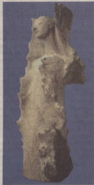
Маржон қоялар маликаси (2002).