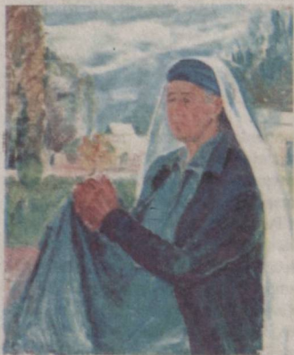
Онам портрети (1990).