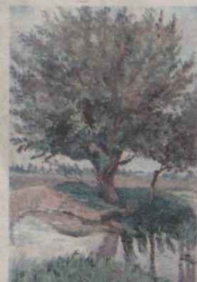
Ариқ бўйида (2017).