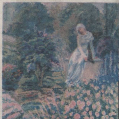
Онам учун бог (2018).