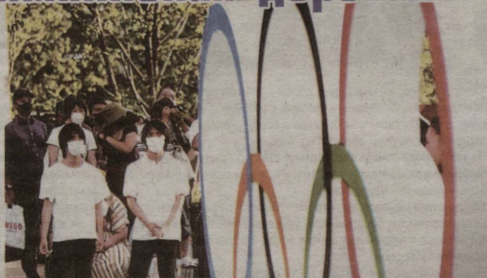
Материалы подготовил Омонжон ТУХТАМИРЗАЕВ

Деревня расположена на берегу Токийского залива.